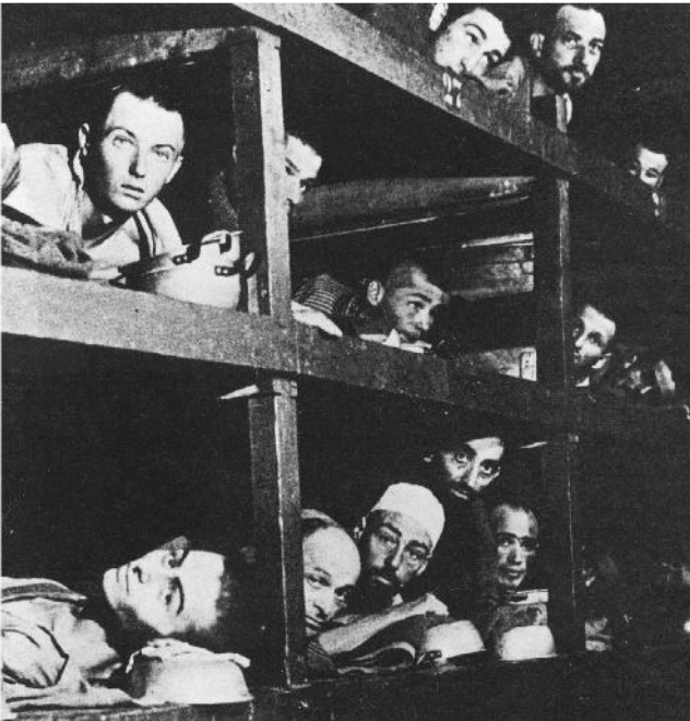
1. Prigionieri a Buchenwald, 1945