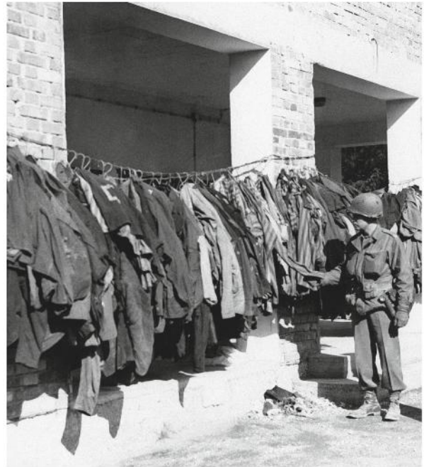
2. Vestiti all'esterno dei forni crematori, Dachau, 1945

3. Un ufficiale medico dell'Armata Rossa accompagna i prigionieri, Auschwitz, 1945